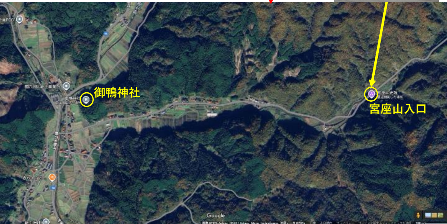
5-2 Google Mapに黄で追記