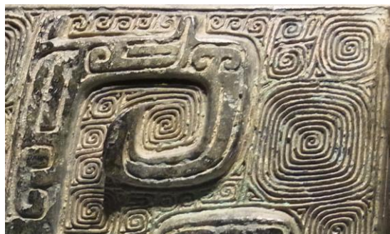
殷時代の中国青銅器に見る渦紋