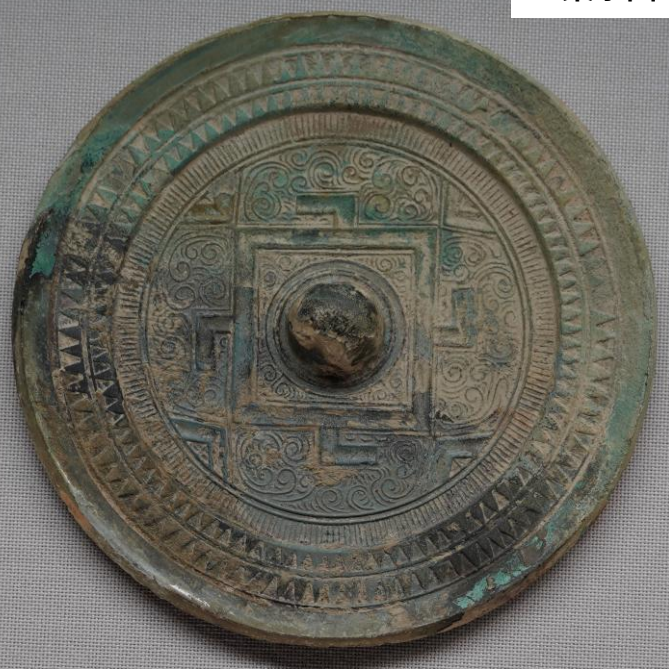
ほうかくききょう 方格規矩鏡